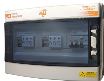
SPF 2/2-40/1000/15 (223) + AC2-25/SP

Asimismo, incluyen protección magnetotérmica y diferencial para la protección en la parte alterna.